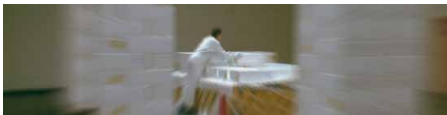
Opbygning af flypalletter med frosne laks

CCB er hjemsted for speditører (11), GSA'er, luftfragtdivisioner for Air France/KLM og SAS og eksprespakkefirmaet TNT, som indenfor professionen ofte betegnes "integrator", idet det har eget verdensomspændende net, indenfor hvilket al håndtering af forsendelserne foregår. Antallet af speditører med faste afdelinger i CCB er fordoblet inden for de sidste par år, hvilket afspejler, at koncentrationen af luftfragtaktiviteter i Vestdanmark har fundet sted i Billund Lufthavn.